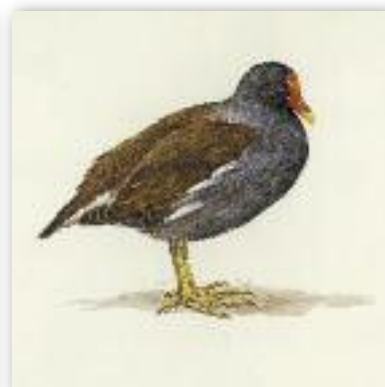
Νερόκοτα - Gallinula chloropus