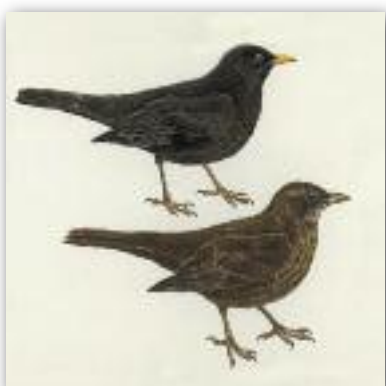
Κότσυφας - Turdus merula