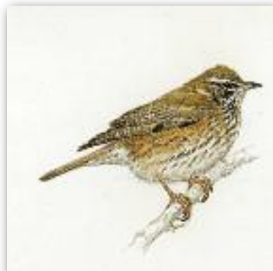
Κοκκινότσιχλα - Turdus iliacus