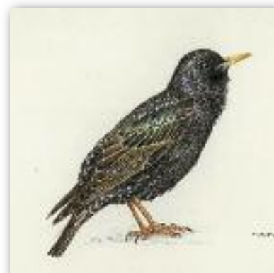
Ψαρόνι - Sturnus vulgaris