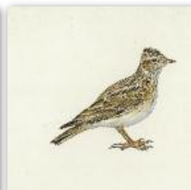
Σταρήθρα - Alauda arvensis