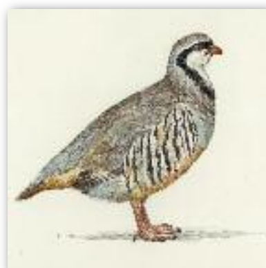
Πετροπέρδικα - Alectoris graeca