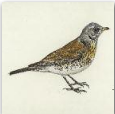
Κεδρότσιχλα - Turdus pilaris