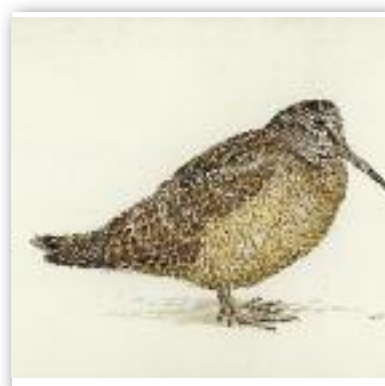
Μπεκάτσα - Scolopax rusticola