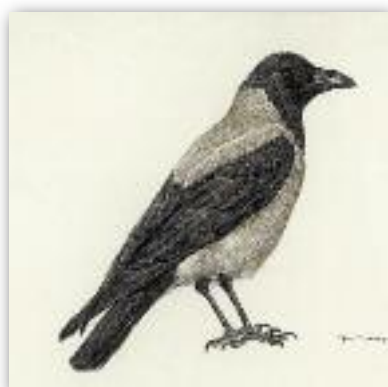
Σταχτοκουρούνα - Corvus corone