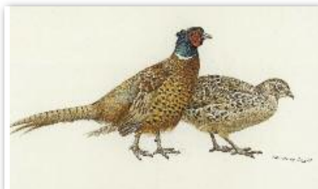
Κυνηγετικός φασιανός - Phasianus colchicus cynigeticus