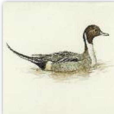
Σουβλόπαπια - Anas acuta