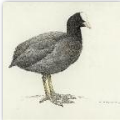
Φαλαρίδα - Fulica atra