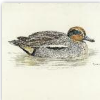
Κικίρι - Anas crecca