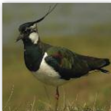
καλημανα vanellus vanellus