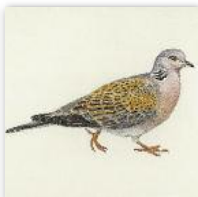
Τρυγόνι - Streptopelia turtur