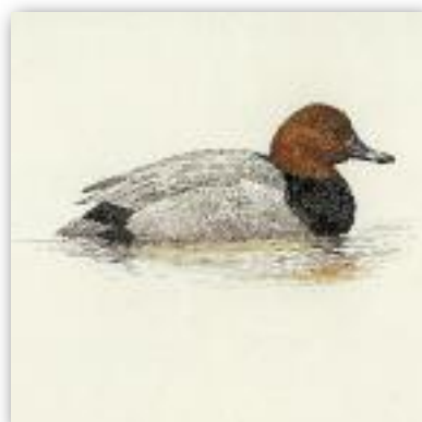
Κυνηγόπαπια - Aythya ferina