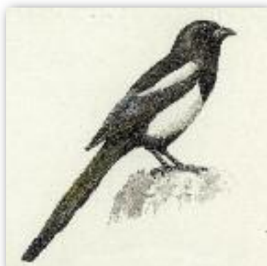
Καρακάξα - Pica pica