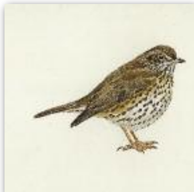
Κελαπδότσιχλα - Turdus philomelos