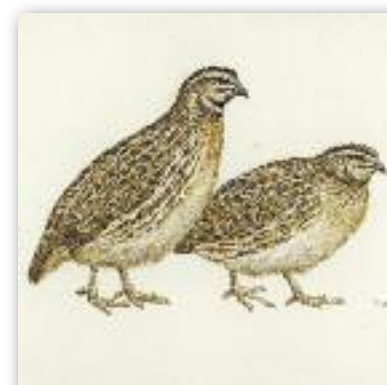
Ορτύκι - Coturnix coturnix