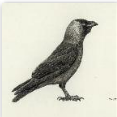
Κάργια - Corvus monedula