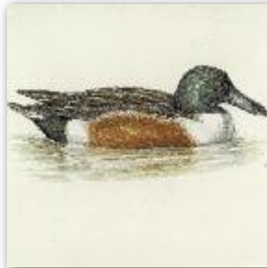
Χουλιάρόπαπια - Anas clypeata