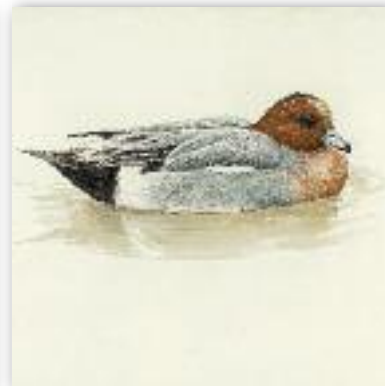
Σφυριχτάρι - Anas penelope