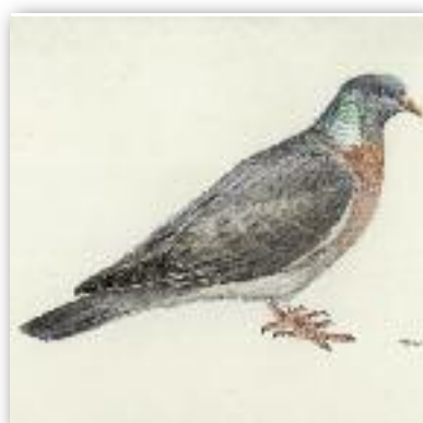
Καρακάξα - Pica pica