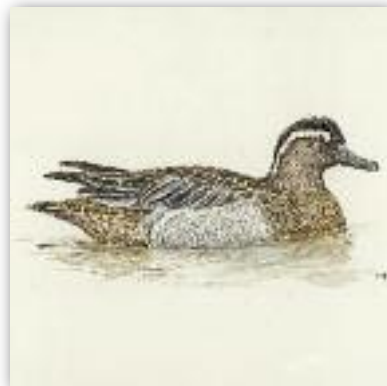
Σαρσέλα - Anas querquedula