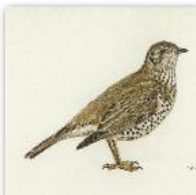
Τσαρτσάρα - Turdus viscivorus