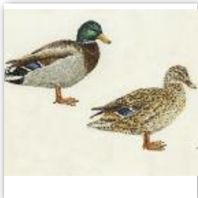
Πρασινοκέφαλη - Anas platyrhynchos