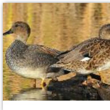
ΦΛΥΑΡΟΠΑΠΙΑ(ΚΑΠΑΚΛΗΣ) anas strepera