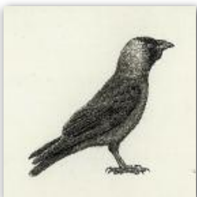
Κάργια - Corvus monedula