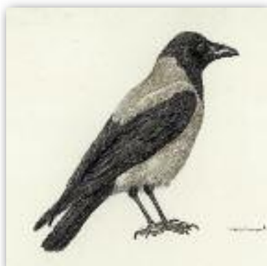
Σταχτοκουρούνα - Corvus corone