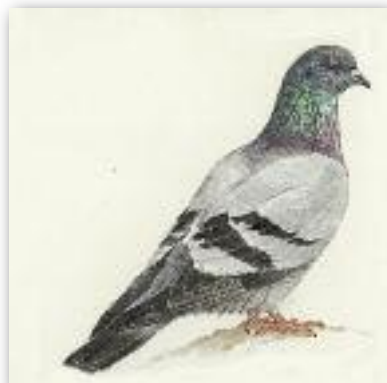
Αγριοπερίστερο - Columba livia