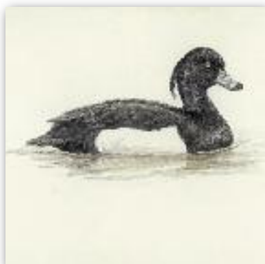
Τσκινόπαπια - Aythya fuligula