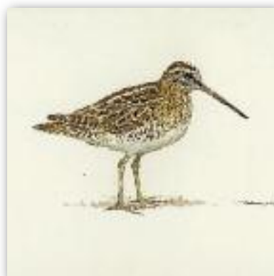
Μπεκασίι - Gallinago gallinago