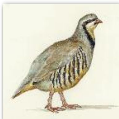
Νησιώτικη πέρδικα - Alectoris chukar