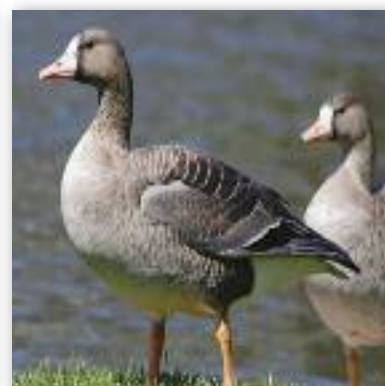
Ασπρομετοπωχνα anser albifrons